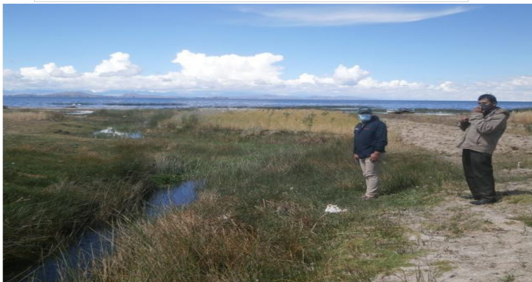
FOTO N°02: En la vista fotografica se observa primero: En la margen derecha se observa viviendas y cultivos de pan llevar que fueron afectadas por las máximas avenidas que se presentó en el año 2021. segundo: Se observa el cauce de la quebrada y material a descolmatar.