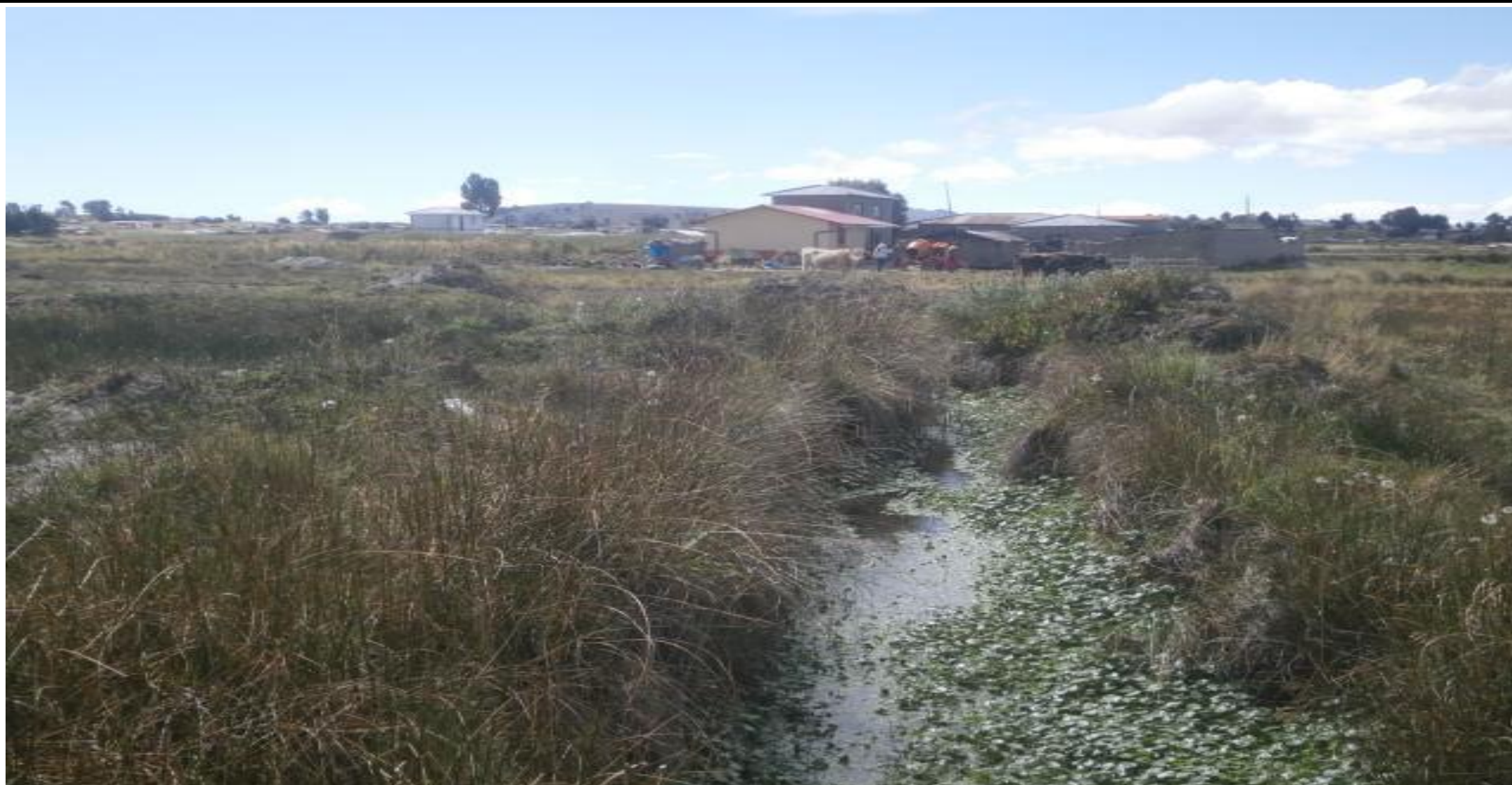
FOTO N°01: En la vista fotografica se observa primero: Cauce de la quebrada Huarileque, colmatado de vegetación, a la margen izquierda se obnserva viviendas; segundo: A la margen derecha se observa una vía de acceso, y material a descolmatar en cauce de la quebrada.